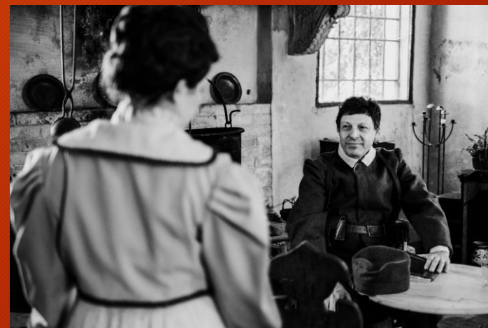
"Il Sogno del Vate Il Volo Roma-Tokio" Castello San Pelagio (PD)